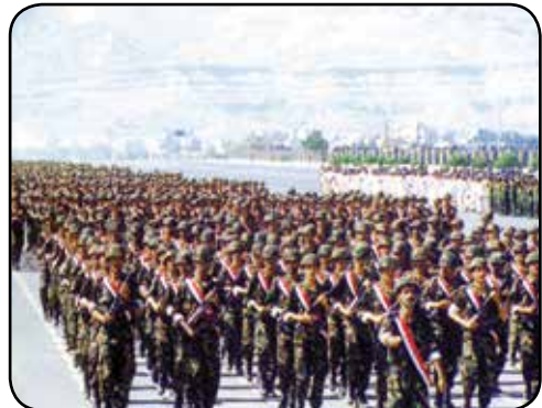
صورة للجيش وبعض الأسلحة الثقيلة