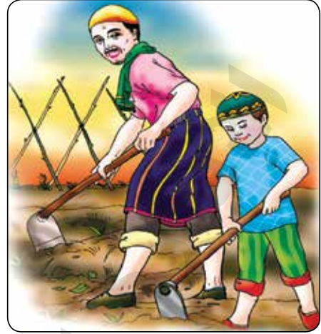
الولد يساعد والده