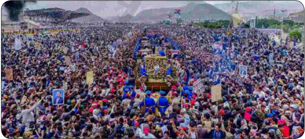
صورة تشييع الشهيد الرئيس الصماد ورفاقه

لم ينكفئ الرئيس الشهيد صالح الصماد على نفسه ويبقى في القصر الجمهوري موجهاً لأوامره وتوجيهاته كأى رئيس في هذا العالم، بل إنه كسر هذا التقليد وحمل سلاحه متحدياً جحافل الغزاة والمرترقة المعتدين على اليمن أرضاً وإنساناً؛ ليجسد بذلك نموذجاً حياً للقائد المؤمن الشجاع أمام أبناء شعبه وأمتة، وليلتحق بركاب الشهداء الخالدين إثر غارة غادرة لطيران العدوان الأمريكي الصهيوني سعودي في يوم الخميس الموافق ١٩ إبريل ٢٠١٨م.