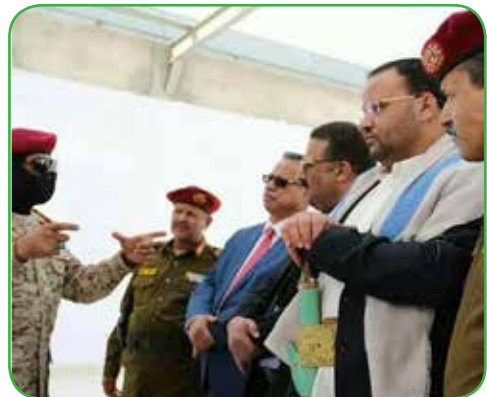
الشهيد الصماد مع بعض المسؤولين.