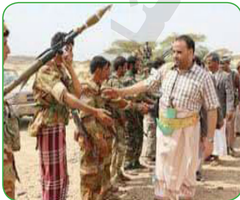
الشهيد الصماد وهو يقوم بزيارة الجبهات