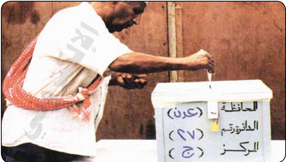
صورة لصندوق الاقتراع وأحدهم يضع بطاقة الاقتراع

هذه القاعدة الدستورية انبثق منها قانون الانتخابات.