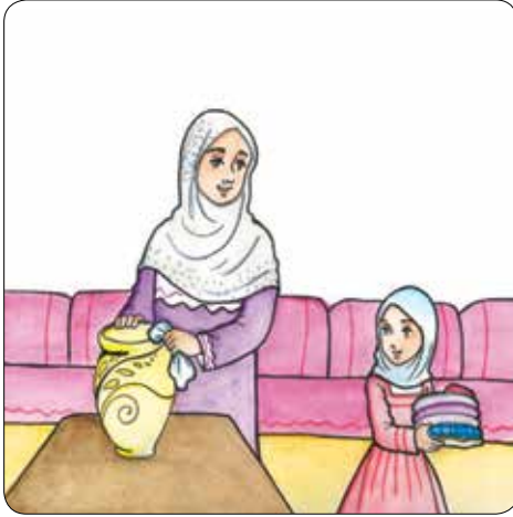
البنات تساعد أمها