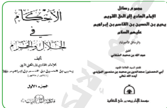
صورة لبغض مؤلفاته