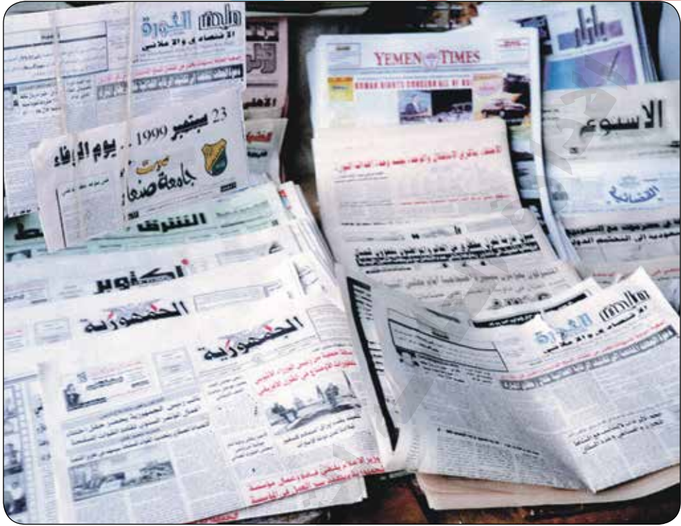
صورة لعدد من الصحف الأهلية والحزبية