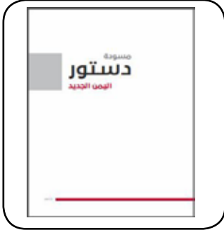
صورة لكتاب الدستور اليمني