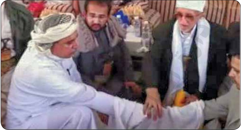
الشكل (٢) كيفية عقد الزواج الشرعي.