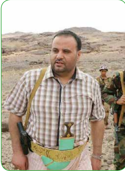
الشهيد الرئيس الصماد

التحق الرئيس الشهيد صالح الصماد بمؤسسة الرئاسة بعد نجاح الثورة