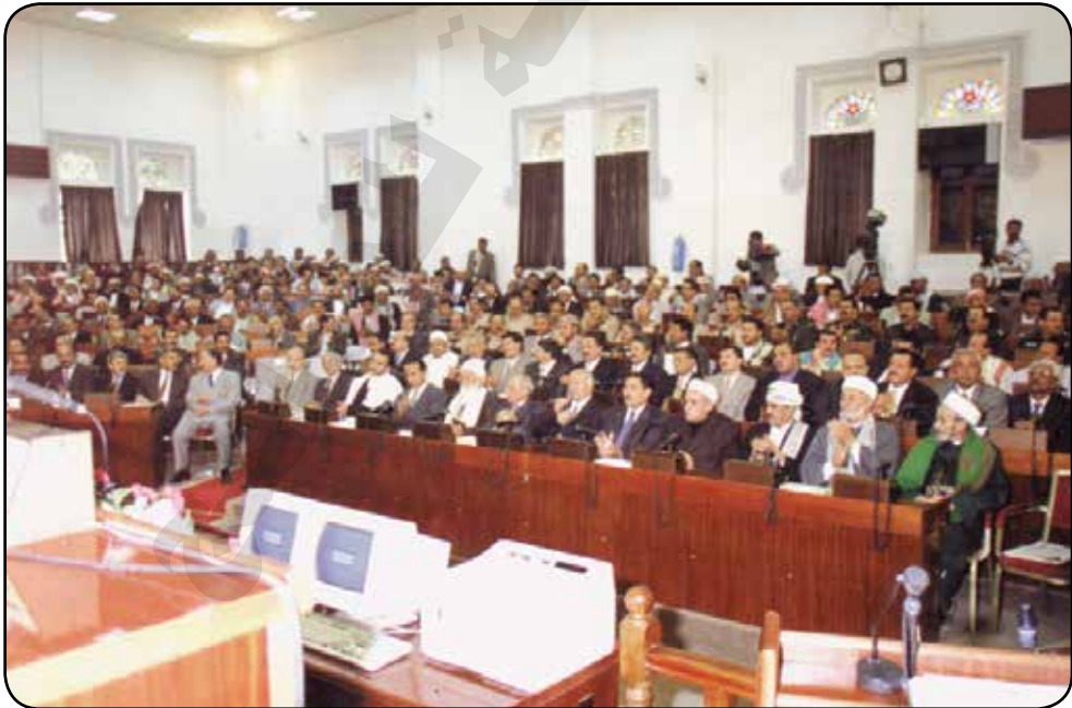
صورة لأعضاء مجلس النواب